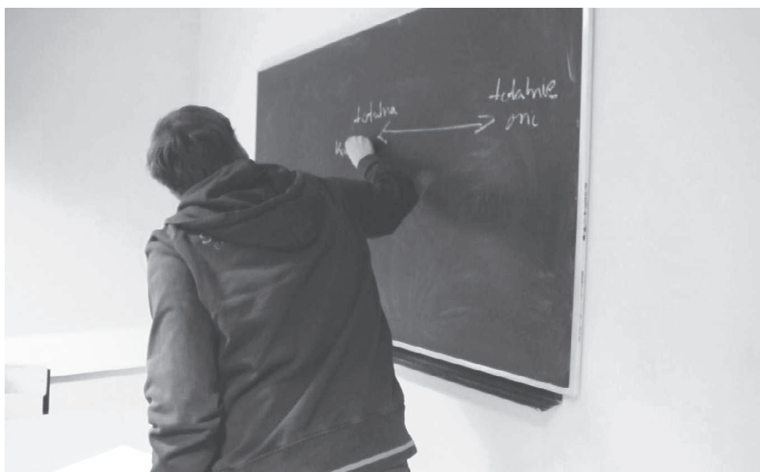
Fotografia 1. Zakres partycypacyjności uczestników — między główną rolą, a źródłem informacji

Od stycznia do maja 2011 roku grupa studentów Instytutu Polityki Społecznej Uniwersytetu Warszawskiego skupiona w Naukowym Kole Filmowym realizowała pod patronatem Stowarzyszenia Pracownia Filmowa „Cotopaxi” projekt wideo uczestniczącego 9 . Działania były skierowane do dzieci i młodzieży uczęszczających do szkół na warszawskim Żoliborzu. Projekt realizowano w partnerstwie z Ośrodkiem Pomocy Społecznej, a dzieci klientów OPS-u zostały zaproszone do uczestnictwa w nim. Celem projektu było przeciwdziałanie wykluczeniu poprzez integrację dzieci z różnych środowisk 10 . Jest to właściwie pierwsze zastosowanie metody participatory video w Polsce.